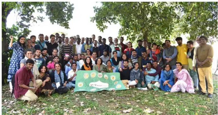
യൂത്ത് വികൽപ്പ സംഗമത്തിൽ നിന്നും.

2019-ലും 2024-ലും പുറത്തിറക്കിയ 'നീതിയും തുല്യതയുമുള്ള സുസ്ഥിര ഇന്ത്യക്ക് വേണ്ടിയുള്ള ജനകീയ അവകാശപത്രിക' കളാണ് വികൽപ്പ സംഗമത്തിന്റെ ന്യായവാദത്തിൽ നിന്നും പുറത്തുവന്ന ഏറ്റവും വലിയ ശ്രമം. ഇന്ത്യ അഭിമുഖീകരിക്കുന്ന സാമ്പത്തിക, സാമൂഹിക, സാംസ്കാരിക, രാഷ്ട്രീയ, പാരിസ്ഥിതിക പ്രശ്നങ്ങൾക്ക് മേലുള്ള വിശദമായ ശുപാർശകൾ ഇവയിലുണ്ട്. രാഷ്ട്രീയ പാർട്ടികളെ അവരുടെ തെരഞ്ഞെടുപ്പ് പ്രചാരണങ്ങളിൽ ഈ വിഷയങ്ങൾ പരിഗണിക്കാൻ പ്രേരിപ്പിക്കുക എന്നത് കൂടാതെ, സംസ്ഥാന തെരഞ്ഞെടുപ്പുകളിലും, പ്രാദേശിക-സംസ്ഥാന സർക്കാരുകളുമായുള്ള ഇടപെടലുകളിലും, സിവിൽ സമൂഹങ്ങൾക്ക് തങ്ങളുടെ പ്രവർത്തനങ്ങൾക്കുള്ള മാർഗനിർദ്ദേശമെന്ന നിലയിലും, വിവിധ അവസരങ്ങളിൽ ഉപയോഗിക്കാനുള്ള ഒരു രൂപരേഖ (ടെംപ്ലേയ്റ്റ്) ആയിട്ടും ഇതിനെ കാണുന്നു. ജൻ സരോകർ പോലെയുള്ള സമാന ലക്ഷ്യങ്ങളുള്ള മറ്റ് ദേശീയ കൂട്ടായ്മകളുമായി വികൽപ്പ സംഗമം യോജിക്കുകയോ സഹകരിക്കുകയോ ചെയ്തിട്ടുണ്ട്.