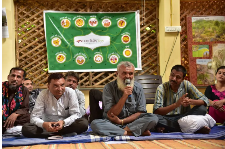
വികൽപ്പ സംഗമത്തിൽ നിന്നും.

വികൽപ്പ സംഗമം പ്രക്രിയയുടെ അഞ്ചാമത്തെയും അവസാനത്തെയും മേഖല ആണ് ന്യായവാദം (അഡ്വക്കസി). രാഷ്ട്രീയമായ സ്വാധീനശക്തി ഇല്ലാതെ നിലവിലെ പ്രബലമായ സ്ഥൂല-രാഷ്ട്രീയ-സാമ്പത്തിക ശക്തികളെ വെല്ലുവിളിക്കുക അസാധ്യമാണെന്ന് വികൽപ്പ സംഗമം അംഗങ്ങൾ തിരിച്ചറിയുന്നു. നിരവധി സംഗമങ്ങളിൽ, പ്രഖ്യാപനങ്ങളിൽ നയ നിർദ്ദേശങ്ങൾ ഉൾപ്പെടുത്തിയിട്ടുണ്ട്. ഉദാഹരണത്തിന്, 2016-ൽ നടന്ന ദേശീയ ഭക്ഷ്യ സംഗമത്തിൽ പങ്കെടുത്തവർ ചേർന്ന് സാമൂഹിക സുസ്ഥിര കൃഷി (കമ്മ്യൂണിറ്റി ബേസ്ഡ് സസ്റ്റെയ്നബിൾ അഗ്രിക്കൾച്ചർ) രീതിക്ക് അനുകൂലമായി ഒരു പ്രഖ്യാപനം നടത്തുകയും ജനിതകമാറ്റം വരുത്തിയ കടുകു ഇന്ത്യയിൽ അവതരിപ്പിക്കാനുള്ള ശ്രമങ്ങളെ എതിർക്കുകയും ചെയ്തു. കശ്മീരിന്റെയും ലഡാക്കിന്റെയും പദവിയിലെ ഭരണഘടനാ മാറ്റങ്ങൾ, ലക്ഷദ്വീപിലെ ജീവിതം വർഗീയവൽക്കരിക്കാനുള്ള ശ്രമങ്ങൾ, ഓറോവില്ലിലെ സർക്കാർ കൈകടത്തൽ, മണിപ്പൂരിലെ വംശീയ സംഘർഷങ്ങൾ പരിഹരിക്കാനുള്ള അടിയന്തിര നടപടികൾ, കോവിഡ് സൃഷ്ടിച്ച പ്രതിസന്ധിയുടെ പശ്ചാത്തലത്തിൽ ജീവനശേഷി (റെസിലിയൻസ്) പ്രദർശിപ്പിച്ച സമൂഹങ്ങളിൽ നിന്നുള്ള പാഠങ്ങൾ എന്നിങ്ങനെയുള്ള വിഷയങ്ങളിൽ പാരിസ്ഥിതിക നീതിക്കും സാമൂഹിക നീതിക്കും വേണ്ടിയുള്ള പ്രാദേശിക സമരങ്ങളെ പിന്തുണച്ച് നിരവധി പ്രസ്താവനകൾ വികൽപ്പ സംഗമം പുറപ്പെടുവിച്ചിട്ടുണ്ട്.