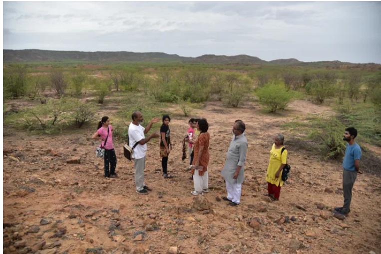
വികൽപ്പ സംഗമത്തിൽ നിന്നും.