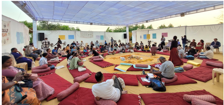
ഗുജറാത്തിലെ ഭുജിൽ വച്ച് നടന്ന വികൽപ് സംഗമത്തിൽ നിന്നും.

പ്രധാന ലക്ഷ്യത്തോടെ 2014-ൽ വികൽപ് സംഗമം ('ബദലുകളുടെ സംഗമം') എന്ന പ്രക്രിയ ആരംഭിച്ചു. ഒരു ദശാബ്ദത്തിനിപ്പുറം, ഈ പ്രക്രിയയെ അവലോകനം ചെയ്യാനും അടുത്ത ഘട്ടം ആസൂത്രണം ചെയ്യാനും സമയമായിരിക്കുന്നു. അതിനായി 2024 നവംബർ 21 മുതൽ 23 വരെ ഗുജറാത്തിലെ ഭുജിൽ വച്ച് സംഘടിപ്പിക്കുകയുണ്ടായി. അതിനിടയിൽ നടന്നതും നടന്നിട്ടില്ലാത്തതുമായ കാര്യങ്ങളെക്കുറിച്ചുള്ള എന്റെ വ്യക്തിപരമായ അഭിപ്രായമാണ് ചുരുക്കത്തിൽ അവതരിപ്പിക്കുന്നത് .