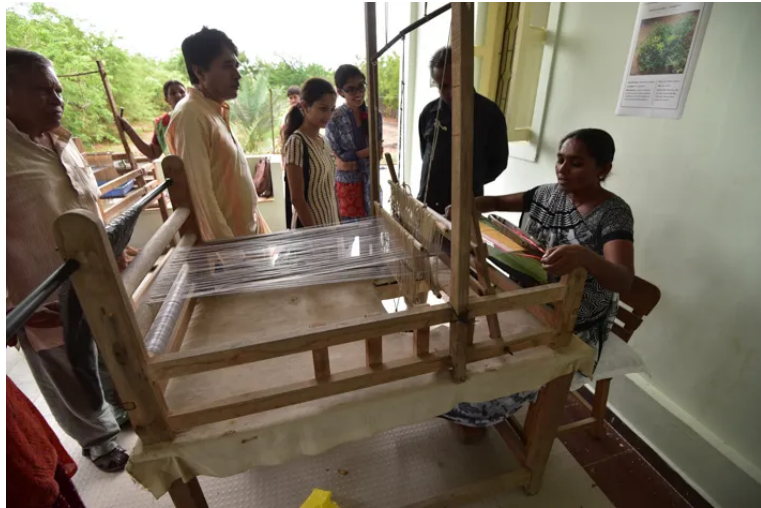
വികൽപ്പ സംഗമത്തിൽ നിന്നും.

പ്രക്രിയയുടെ മൂന്നാമത്തെ പ്രധാന മേഖല അറിവുകളും കഴിവുകളും പങ്കിടലും, തമ്മിൽ സഹകരിച്ച് പ്രവർത്തിക്കലും ആണ്. 3-4 ദിവസത്തേക്ക് ആളുകൾ ഒത്തുചേരുന്ന സംഗമങ്ങളാണ് ഏറ്റവും ആവേശകരമായത്. 2024-ന്റെ തുടക്കത്തിലെ കണക്കനുസരിച്ച്, ഇന്ത്യയിലെ വിവിധ സംസ്ഥാനങ്ങളിലായും പ്രാദേശികമായും ഏകദേശം 30 സംഗമങ്ങൾ നടന്നിട്ടുണ്ട്. ഊർജം, ഭക്ഷണം, യുവത്വം, ജനാധിപത്യം, പരമ്പരാഗത ലോകവീക്ഷണങ്ങൾ, ബദൽ സമ്പദ്വ്യവസ്ഥകൾ, ആരോഗ്യം, ക്ഷേമവും നീതിയും, പരമ്പരാഗത ഭരണനിർവഹണം, മധ്യേന്ത്യയിലെ സമാധാനം, എന്നിങ്ങനെ വിഷയാധിഷ്ഠിതമായ സംഗമങ്ങളും ഇതിൽ ഉൾപ്പെടും. ഈ ഒത്തുചേരലുകളിൽ ഗൗരവമേറിയ സംവാദങ്ങൾക്കൊപ്പം, പഠനയാത്രകളും, നൈസർഗിക പ്രവർത്തനങ്ങളും, ബദൽ ഉൽപ്പന്നങ്ങളുടെ പ്രദർശനവും മറ്റും ഉൾപ്പെടുന്നു. ഇതുവരെ പങ്കെടുത്ത ഏതാനും ആയിരം ആളുകൾ സിവിൽ സൊസൈറ്റി സ്ഥാപനങ്ങൾ, കൃഷി, അജപാലനം, കരകൗശല-അധിഷ്ഠിത, മറ്റ് ഭൂമി അധിഷ്ഠിത സമൂഹങ്ങൾ, വിവിധ മേഖലകളിലെ പ്രൊഫഷണലുകൾ, ഉദ്യോഗസ്ഥരും രാഷ്ട്രീയക്കാരും അവരുടെ വ്യക്തിഗത ശേഷിയിൽ, ബദൽ വ്യവസായങ്ങൾ, എന്നീ മേഖലകളിൽ നിന്നുള്ളവരാണ്.