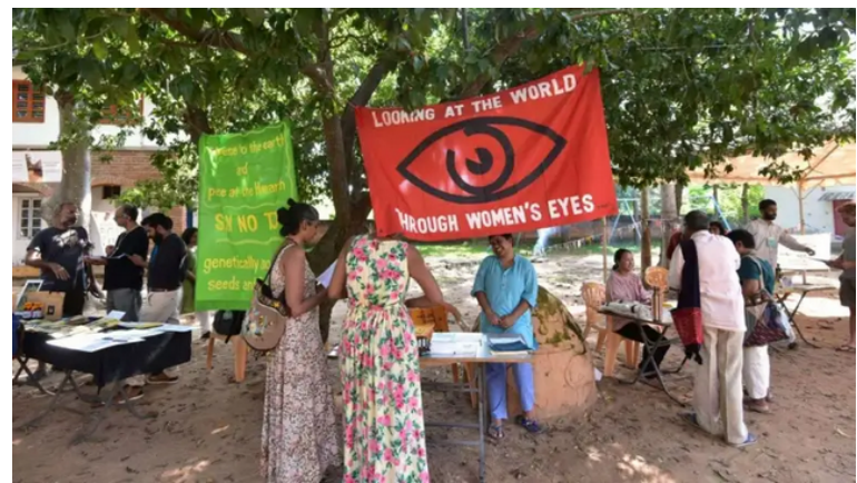
ആൾട്ടർനേറ്റീവ് ഇക്കോണമിസ് വികൽപ്പ സംഗമം.

2019-ൽ ഗ്ലോബൽ ട്രേപ്പിംഗ് ഓഫ് ആൾട്ടർനേറ്റീവ്സ് (ബദലുകളുടെ ആഗോള തിരശ്ശീല) സമാരംഭിക്കുന്നതിന് ലോകത്തിന്റെ മറ്റ് ഭാഗങ്ങളിലുള്ള സമാന ശൃംഖലകളുമായും ഉദ്യമങ്ങളുമായും വികൽപ്പ സംഗമം ബന്ധപ്പെടുകയുണ്ടായി. വികൽപ്പ സംഗമം ഇപ്പോൾ ആഗോള തിരശ്ശീലയുടെ 'നെയ്ത്തുകാരിൽ' ഒരാളായി (കൊളംബിയ, മെക്സിക്കോ, തെക്ക്-കിഴക്കൻ ഏഷ്യ എന്നിവിടങ്ങളിലെ മറ്റ് നെയ്ത്തുകാരോടൊപ്പം), മറ്റ് അംഗങ്ങളോടൊത്ത് പഠനത്തിലും കൂട്ടായ പ്രവർത്തനങ്ങളിലും ഏർപ്പെട്ടിരിക്കുന്നു.