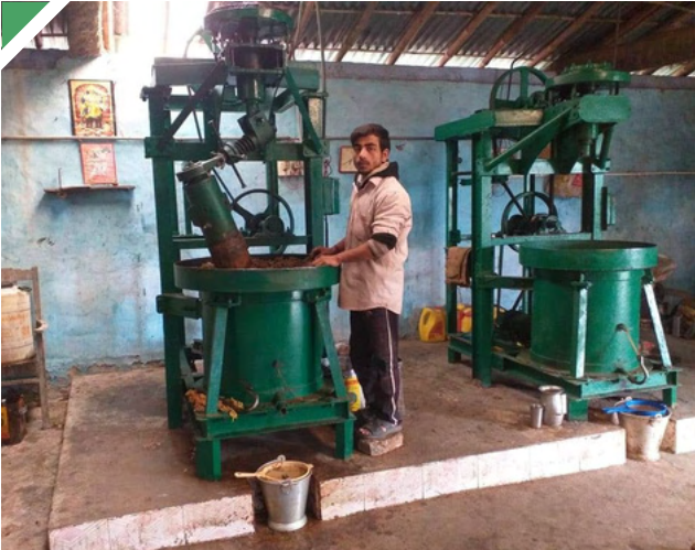
ബിഹാറിൽ സ്ഥാപിച്ച എണ്ണ ഉല്പാദനയന്ത്രം