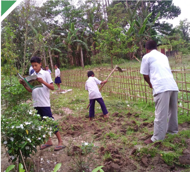
അലങ്മോറ ഹൈസ്കൂളിൽ പഠനവും പ്രവൃത്തിയും