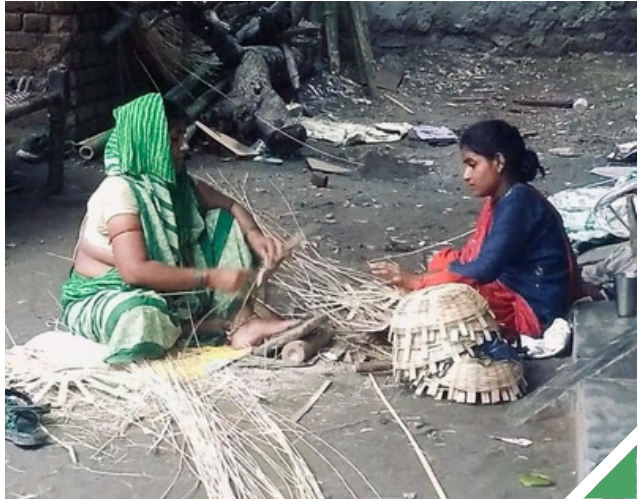
ഫരിദാബാദ് വനിതകൾ മുളകൊണ്ട് കൊട്ട നിർമ്മിക്കുന്നു