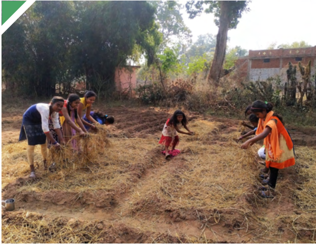
പ്രാദേശിക വിത്തിനങ്ങൾ കൃഷി ചെയ്യുന്നു

ബന്ധങ്ങൾ ശക്തിപ്പെടുത്തലും പ്രതീക്ഷ കണ്ടെത്തലും