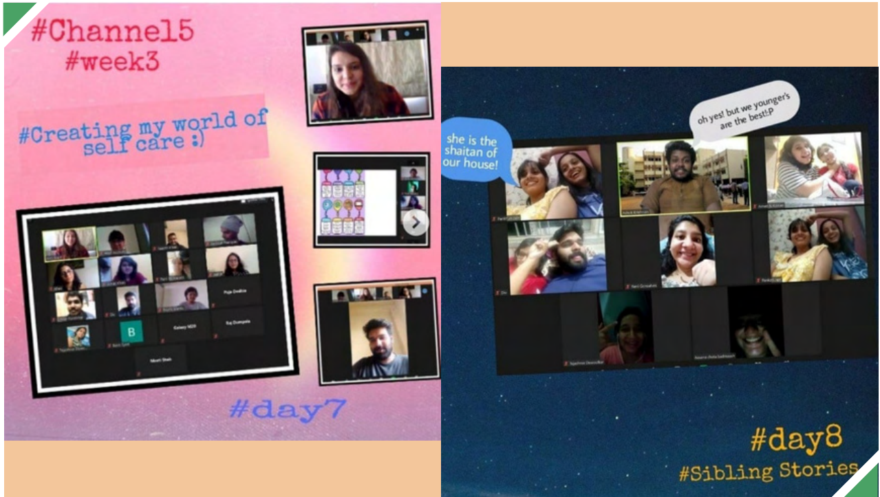
ചാനൽ 5 ഓൺലൈൻ പരിപാടികൾ

മുംബൈയിലെ യുവജനങ്ങളുടെ പ്രസ്ഥാനമാണ് 'ബ്ലൂ റിബ്ബൺ മൂവ്മെന്റ്' (ബിആർഎം) എന്നപേരിൽ അറിയപ്പെടുന്ന സംഘടന. ഒരു നവലോകത്തിനു വേണ്ടിയുള്ള യുവജനമുന്നേറ്റത്തിന് നേതൃത്വം നൽകുകയാണ് അതിന്റെ ലക്ഷ്യം. അഗാധമായ ജനാധിപത്യ സമീപനമാണ് അതിന്റെ രീതി; ഓരോ തീരുമാനവും മുഴുവൻ അംഗങ്ങളുടെയും പൂർണ്ണസമ്മതത്തോടെയാണ് സ്വീകരിക്കപ്പെടുന്നത്.