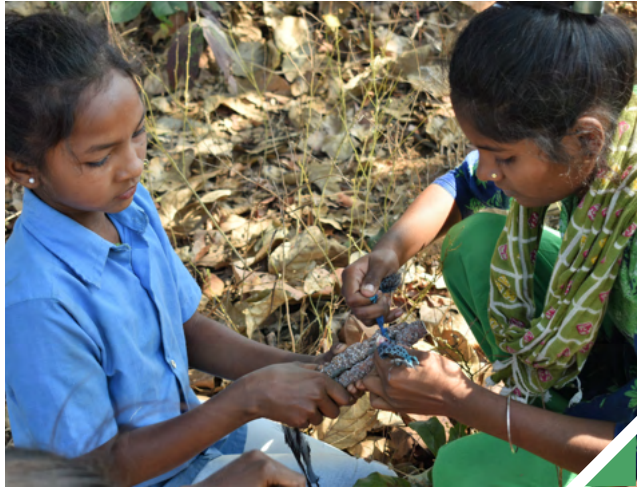
അരക്ക് കെട്ടുകളാക്കി മാറ്റുന്നു

ഛരത്തിസ്ഗഡിൽ പ്രവർത്തിക്കുന്ന യുവജനസന്നദ്ധ സംഘടനയാണ് 'ചിന്നരി: ദി യങ് ഇന്ത്യ'. അതിൽ അധികം പ്രവർത്തകരും വനിതകളാണ് (എന്നാൽ പുരുഷന്മാർക്കും അംഗത്വം ലഭ്യമാണ്). സംസ്ഥാനത്തെ വിദ്യാഭ്യാസങ്ങളിൽ സാമൂഹിക പുനരുദ്ധാരണം ലക്ഷ്യം വെച്ചുകൊണ്ടുള്ള പ്രവർത്തനങ്ങളാണ് സംഘടന നടത്തുന്നത്. ഡാത്തരി, കാങ്കർ ജില്ലകളിലെ അഞ്ചുഗ്രാമങ്ങളിലായി ഏതാണ്ട് നൂറോളം സ്ത്രീകളും പുരുഷന്മാരുമായി അത് പ്രവർത്തിക്കുന്നു. ചിന്നരി പദ്ധതിയിൽ ഗ്രാമങ്ങളിലെ സ്വാഭാവിക അന്തരീക്ഷത്തിൽ എങ്ങനെ സന്തുഷ്ടമായ ജീവിതം കെട്ടിപ്പടുക്കാം എന്ന പാഠങ്ങളാണ് നേടിയെടുക്കാൻ ശ്രമിക്കുന്നത്. ജനാധിപത്യ രീതിയിലുള്ള പ്രവർത്തന സംവിധാനമാണ് അത് വിഭാവനം ചെയ്യുന്നത്. ഗ്രാമത്തലവന്മാരെല്ല, മറിച്ചു മുഴുവൻ ജനങ്ങളെയും ഒന്നിച്ചു അണിനിരത്തി പരിപാടികൾ ആസൂത്രണം ചെയ്യുകയാണ് അതിന്റെ രീതി. കഴിഞ്ഞ ഏതാനും വർഷങ്ങളിൽ ചിന്നരി പ്രവർത്തകർ നേതൃത്വം നൽകിയ ചില പദ്ധതികളാണ് താഴെ: