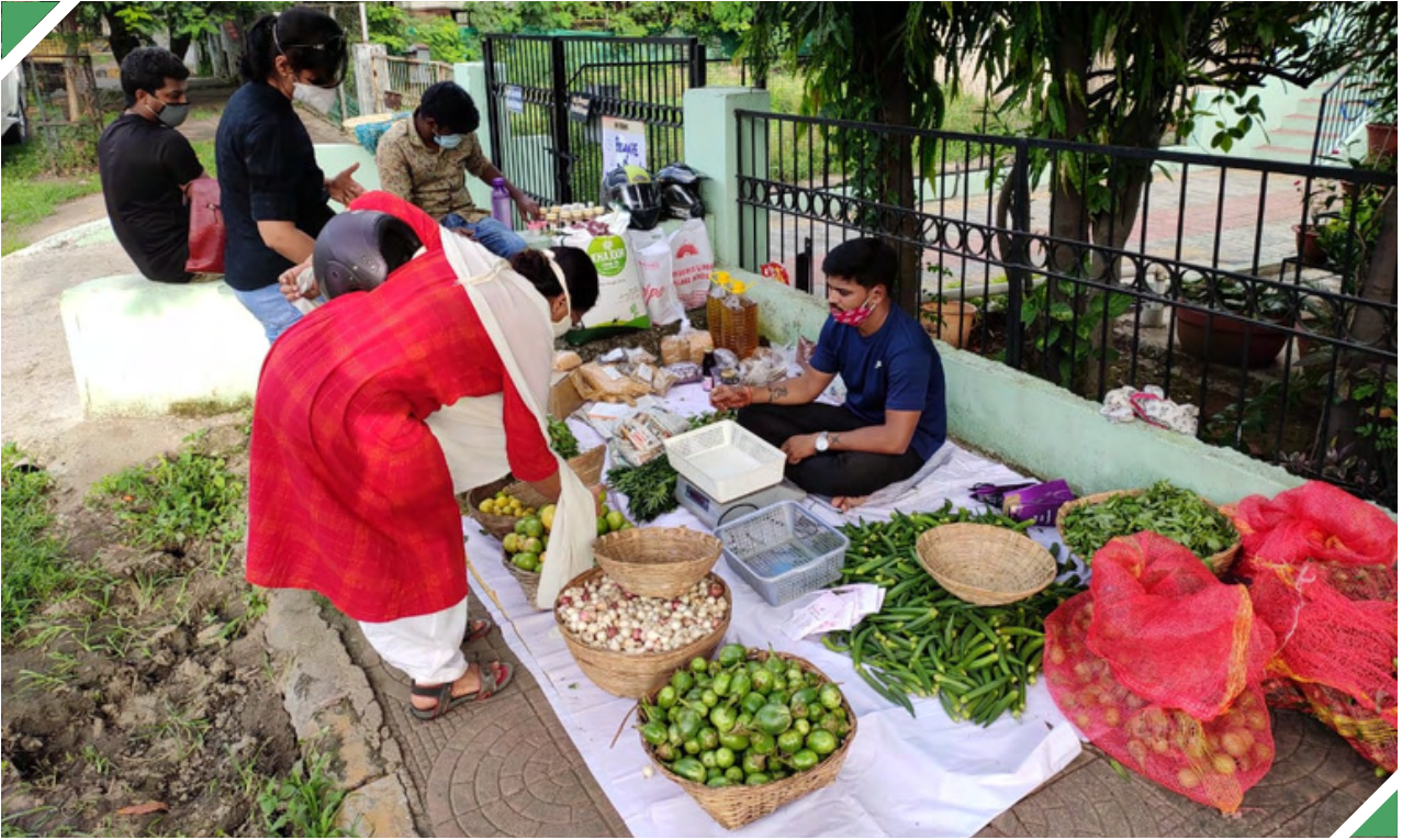
കോവിഡ് കാലത്തു തെരുവിൽ സംഘടിപ്പിച്ച പച്ചക്കറി ചന്ത

കർഷകരും ഉപഭോക്താക്കളും തമ്മിലുള്ള ബന്ധം ഊട്ടിയുറപ്പിക്കൽ