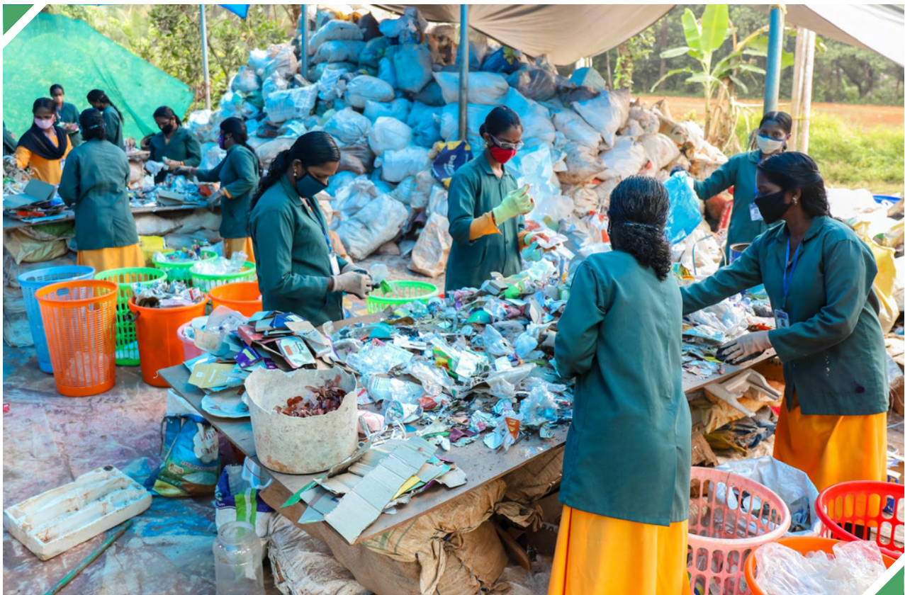
പുൽപ്പറ്റ പഞ്ചായത്തിലെ സ്വയംസഹായസംഘം അംഗങ്ങൾ മാലിന്യം വേർതിരിക്കുന്നു