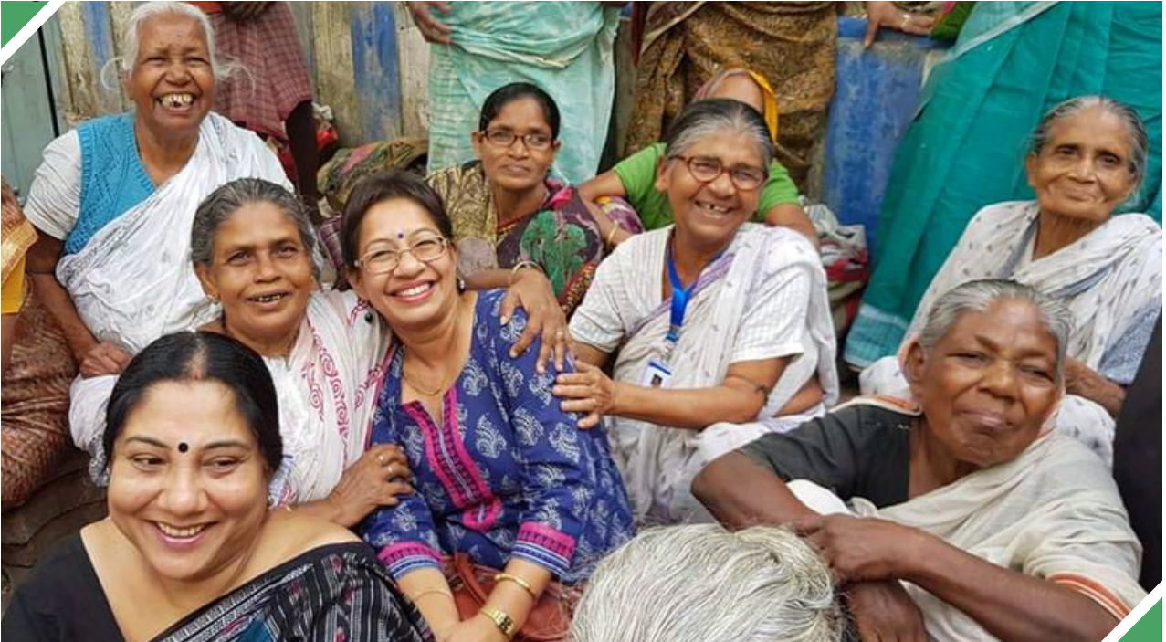
സ്നേഹത്തിന്റെയും സന്തോഷത്തിന്റെയും നിമിഷങ്ങൾ