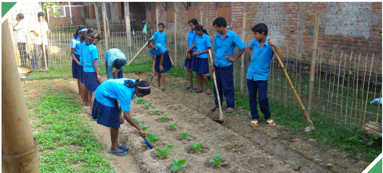
മോഹനത്തിന്റെ ഹൈസ്കൂൾ വിദ്യാർത്ഥികൾ തോട്ടം പരിചരണത്തിൽ