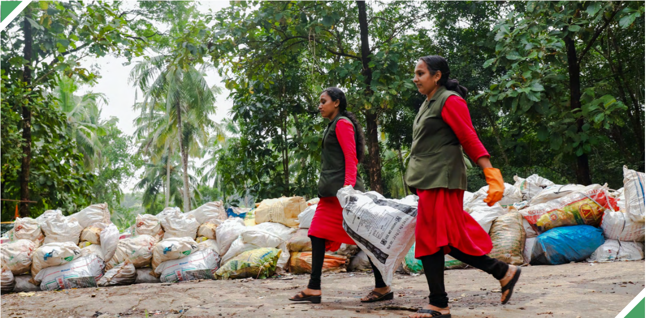
ചാലിയാർ ഗ്രാമപഞ്ചായത്തിലെ ഹരിത കർമ്മസേനാംഗങ്ങൾ മാലിന്യം ശേഖരിച്ചു കേന്ദ്രത്തിൽ എത്തിക്കുന്നു